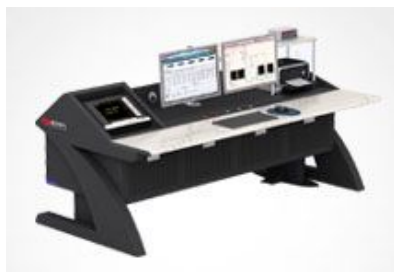
电机试验台典型案例

前端数字化_复杂电磁环境下的高精度测量解决方案 不同功率因数下相位误差对功率测量准确度的影响 幅值对测量准确度的影响？ 准平均值真的可以替代基波有效值吗？